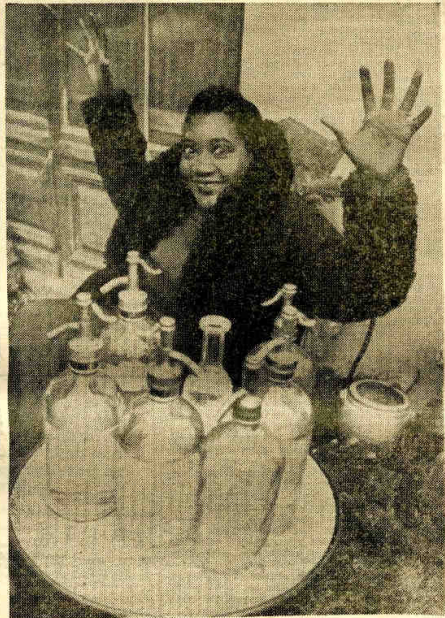
"ALEGRIA DE COLOR" (PARIS)

Entre todos los rasgos estéticos que dan fisonomía a nuestro tiempo, ninguno tan definidor—junto con el cine y la arquitectura racionalista o funcional—como el rumbo trazado a nuestra vida óptica por la nueva fotografía. ¡Curiosa paradoja la aventura corrida por la cámara fotográfica! Después de tantos años de existencia, no ha llegado a revelarnos su alma, su razón de ser genuina, su categoría artística independiente, hasta hace muy poco tiempo. Lo corrobora uno de los partecitos del nuevo arte, el pintor y fotógrafo Moholy-Nagy, cuando escribe: "Hace cien años que la fotografía fué inventada, pero sólo ahora acaba de ser descubierta". Y agrega: "Durante muchos años se le empleó mal: dió la imagen de formas rígidas en vez de flujar el flujo, hasta ahora inaprehensible, de la sombra y de la luz". Otra autopsia. No es la fotografía—como suele pensarse—la que ha originado el cine. Es el cine quien ha dado nacimiento a la fotografía, al menos a la nueva fotografía con sus inéditos ángulos de visión, con sus perspectivas inesperadas. ¿Por qué? Porque el cine—y no tampoco en sus comienzos, sino al acercarse ya a su madurez y poner en movimiento la cámara, antes quieta—es lo que hizo ver, por vez primera, el valor gráfico y plástico de las imágenes sueltas, la belleza, el dramatismo, el humor o la superrealidad de ciertos jirones reales que antes no advertíamos. Antes, la fotografía había quedado