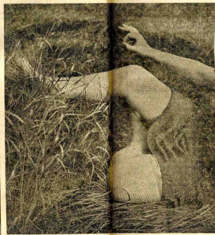
"LAS MEDIAS" (PARIS)